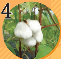
4 布雑貨 村上メリヤス