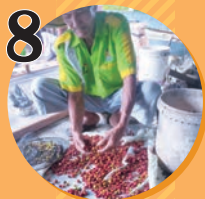
8 ボトルコーヒー THEcoffeetime