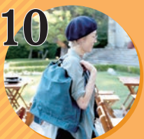
10 旅のかばん ichimaruni(イチマルニ)