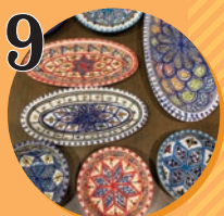
9 輸入雑貨 旅cafe黄色い家