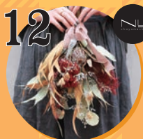
12 生花・ドライフラワー bois de gui et