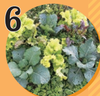
6 野菜・ドライフラワー PlantsPlanetぶらぶら