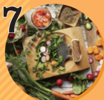
7 オーガニック食材 大阪オーガニックまかおん・ふあみーゆ