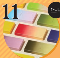
11 チョコレート・革小物 MOTHERHOUSE