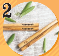
2 箸と皿 架け箸