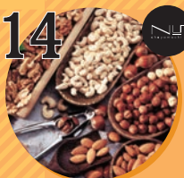
14 豆菓・ドライフルーツ NutsDOM