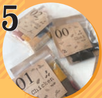
5 スパイス SLOKA SPICE WORKS.