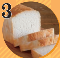
3 米粉パン・お菓子 米粉LOVERS