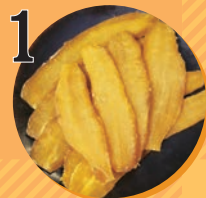
1 無添加干し芋 いも吉