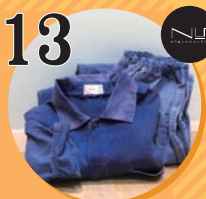
13 ヴィンテージウェア Hemming shop